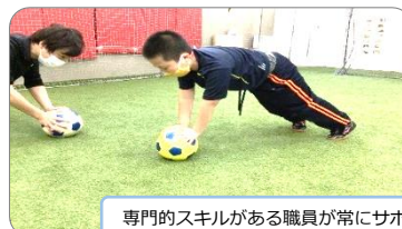
専門的スキルがある職員が常にサポート。

障害者スポーツ指導員、理学療法士、日本サッカー協会公認ライセンス、など専門知識を持つ職員が感覚統合を促すプログラムを作成しています。マットやボールを使用した運動療育に安全に取り組んでいただけます。