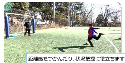
距離感をつかんだり、状況把握に役立ちます。

土曜日は近くのフットサル場でサッカー療育を行います。身体を動かすことで筋肉や関節、バランス感覚を養い、生活動作をサポートします。また身だしなみや健康管理も学びます。