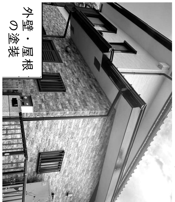
外壁・屋根 の塗装